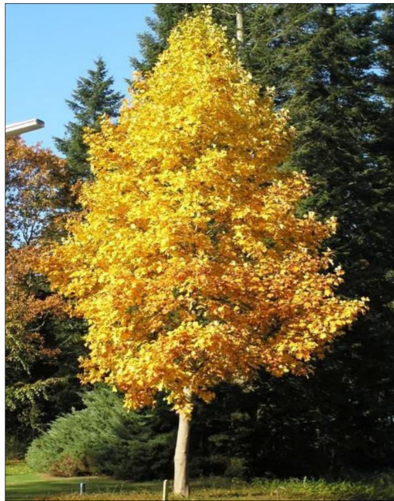
1 LIRIODENDRON TULIPIFERA (Albero dei tulipani)