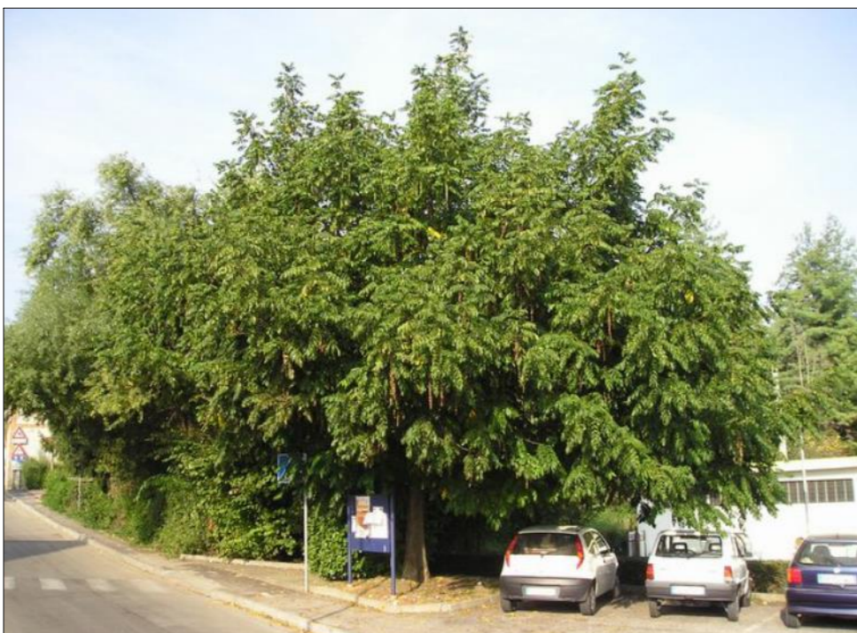
2 PTEROCARYA FRAXINIFOLIA (Noce del Caucaso)