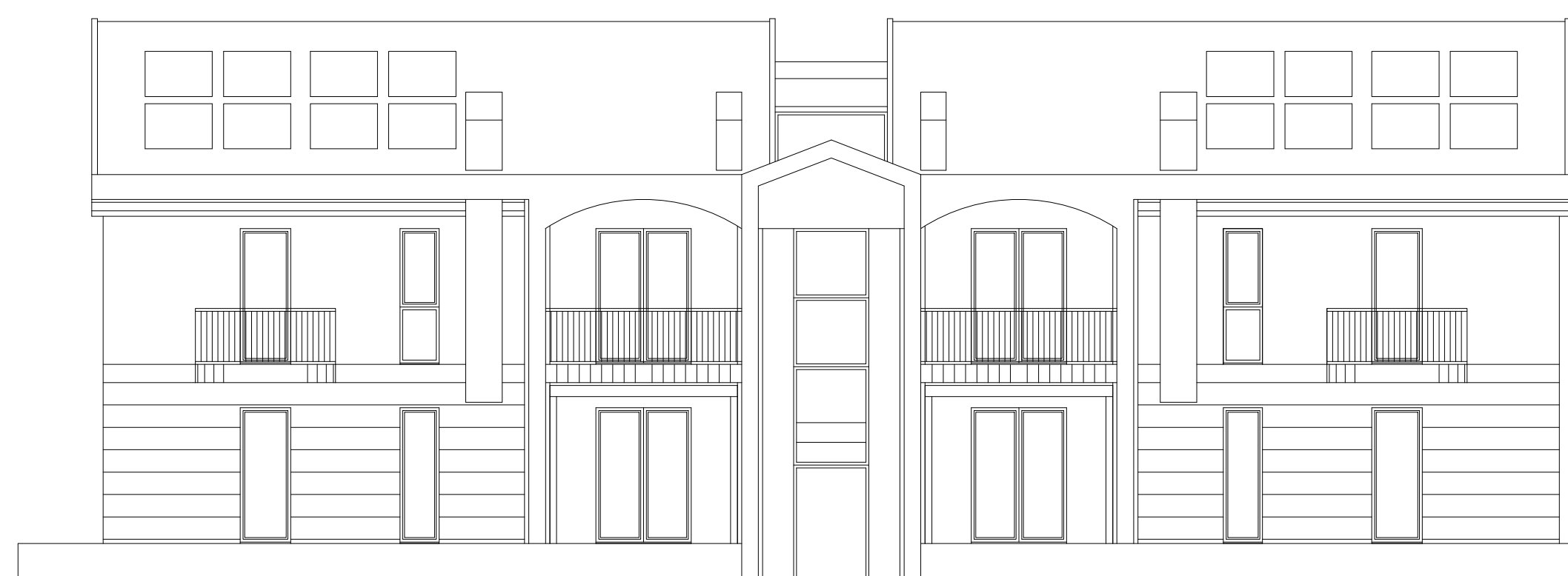
SEZIONE A - A 1:100